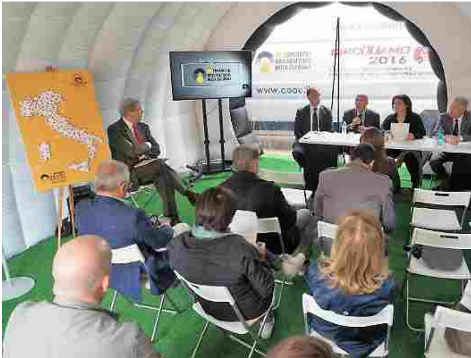
CircOLIamo in Piazza del bacio